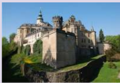
Hrad - zámek Frýdlant