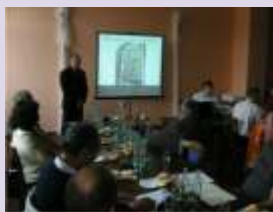
Veřejné slyšení žadatelů

ostatních těchto Fichí, tak aby předložené alokace co nejlépe odpovídaly požadovaným částkám. Definitivně tak bylo schváleno podání projektu doporučených k realizaci s předloženými částkami předložené dotace.