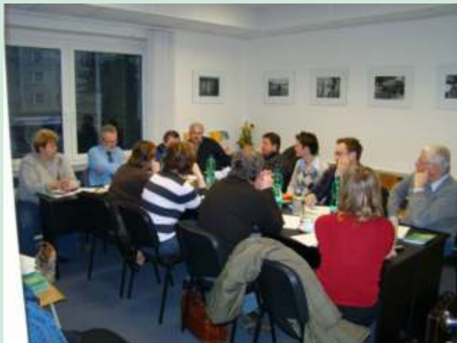
Rada MR Hranicko - leden 2009

Jakými aktivitami pokračovat v innosti mikroregionu Hranicko v roce 2009 a následujících? Tímto se zabývala Rada mikroregionu Hranicko v lednu 2009. Na základ tohoto jednání vznikla koncepce inností Mikroregionu