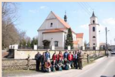
Společná foto před kostelem v Zawadzkie

Ve spolupráci s projektovou manažerkou z Kolonowskie se podařilo připravit opravdu