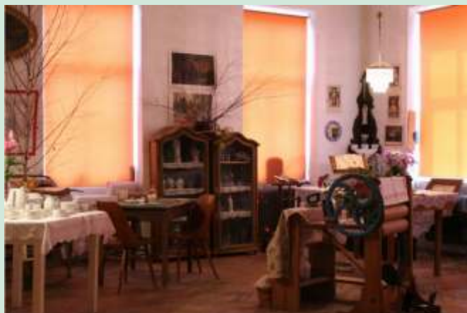
Projekt podpořil vznik expozic, jako je ta v Horním Újezdě

jiné aktivně zapojit místní obyvatele do realizace jednotlivých aktivit. Učitelé základních škol na Hranicku budou spolupracovat na tvorbě stolních her, občanské jednotlivých obcí mikroregionu budou moci navrhnout a hlasovat o Nejnámějšího rodáka a poskytnout své tradiční rodinné recepty do regionální kuchárky. Obyvatelé mikroregionu budou moci prostřednictvím těchto aktivit hlouběji poznat místní kulturní, historické a přírodní atraktivitu a ztotožnit se tak více s územím, v němž žijí. Výstupy projektu mohou v neposlední řadě sloužit jako prezentační materiály Hranicka v partnerských mikroregionech.