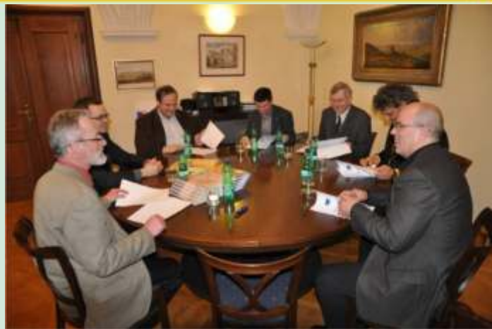
Podpis partnerské smlouvy o realizaci programu dne 23. 3. 2009

zástupců zapojených firem podle předem dohodnutých kritérií. Rozhodující jsou například jak má organizátor zajišťovat propagaci a organizaci své akce, jestli pro organizaci využívá místních zdrojů, důležitá je také lenství obce, ze které pochází žadatel nebo ve které je akce plánována, ve svazku obcí Mikroregion Hranicko. V případě, že zájemce úspěšně kromě povinnosti realizace akce popsané