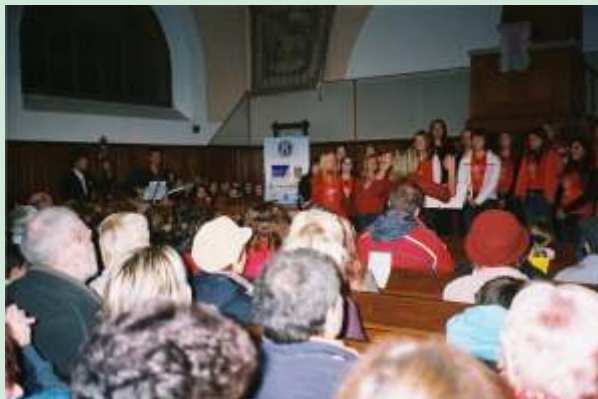
Koncert v evangelické kostele v Hranicích – jedna z lokálních podporovaných akcí

Olomouckého kraje jako pilotní program, který měl otestovat nový způsob spolupráce obcí a soukromých firem. Výsledkem této spolupráce v minulém roce byla podpora série 16 kulturních a sportovních akcí a několik doprovodných aktivit jako například vzdělávací akce pro poskytovatele akcí nebo databáze uměleckých souborů na Hranicku, která nyní funguje v elektronické podobě. Díky programu si firmy získaly nejen propagaci přesahující výši jejich příspěvku, odbouraly administrativu spojenou se sponzoringem, ale v neposlední řadě se mohly zapojit do společné práce na rozvoji regionu.