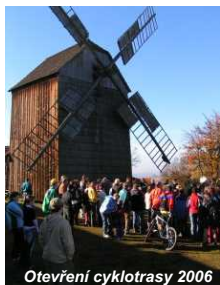
Otevření cyklotrasy 2006

jetí trasy je zcela libovolná. Úspěšní účastníci obdrží pamětní plakety, budou zařazeni do slosování o hodnotné ceny (např. poukázka na cykloboží za 4.000 Kč a další!) a především