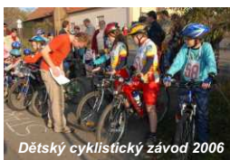
Dětský cyklistický závod 2006

2) Mikroregion by měl nadále pomáhat obcím v získání peněz z různých dotací, především pomocí při zpracování žádostí.