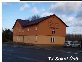
TJ Sokol Ústí