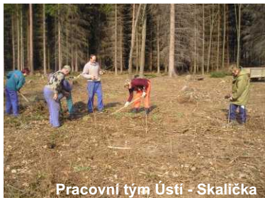
Pracovní tým Ústí - Skalicka

Součástí projektu jsou samozřejmě další aktivity. Pracovníci mají možnost absolvovat rekvalifikační kurz na práci s ruční motorovou pilou a křovinořezem, v těchto dnech už někteří z nich tento kurz úspěšně dokončili a získali osvědčení. Někteří účastníci získají dokonce možnost rekvalifikace přímo podle svých