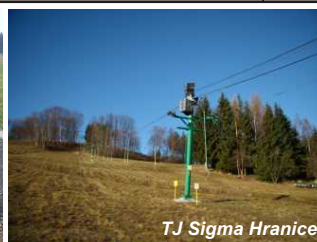
TJ Sigma Hranice