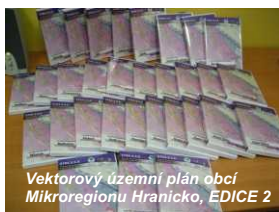
Vektorový územní plán obcí Mikroregionu Hranicko, EDICE 2

Pro sestavení atlasu budou použita data a informace shromážděné v projektu Stra.S.S.E. v prostředí geografického informačního systému (GIS) využívaného nejen pro tvorbu map, ale i pro složité prostorové analýzy. Digitální data v databázi GIS Mikroregionu Hranicko jsou jedním z nejdůležitějších výstupů projektu. Součástí GIS je také bežešvý digitální územní plán Mikroregionu Hranicko. Je sestaven na CD jako EDICE 3, finální a nejdůležitější produkt předcházejících dílčích výstupů EDICE 1 a EDICE 2. Bežešvý digitální územní plán zahrnuje územní plány všech obcí spadajících pod město Hranice jako obce s rozšířenou působností. Výstupy projektu Stra.S.S.E. položily základ kvalitnímu regionálnímu geografickému informačnímu systému, který bude významným prvkem systému podpory rozhodování a přípravy kvalitních projektů na lokální i regionální úrovni a zdrojem mnoha dalších prostorových informací.