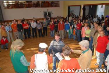
Vyhlašování výsledků soutěže 2006

ku celoroční soutěže Mlynářský krajánek 2007, ve které mohou mimo jiné vyhrát i zajímavé hodnotné ceny. Stačí pár věcí: v soutěžním průkazu odpovědět na sadu otázek (informace poskytnou infotabule na trati), posbírat 8 kontrolních razítek z vybraných hospůdek na trase a vyplněný průkaz odevzdat do 15. září 2007. Soutěž bude zahájena 21. dubna, průběh a doba pro-