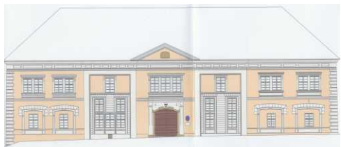
Návrh fasády zámku Potštát

V období 2006 až 2007 projekt pokračoval školením Místních pracovních skupin v partnerských obcích, které se seznámily s metodami a organizací komunitního plánování. Poté proběhly ve Stříteži n. L., Potštátě a Hustopečích n. B. dvoudenní plánovací vikendy. Všude se řešená témata (zámky, zámecké parky a zahrady, náměstí, dopravní studie) setkaly s