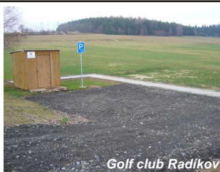
Golf club Radíkov