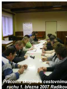
Pracovní skupina k cestovnímu ruchu 1. března 2007 Radíkov

Do přípravy dotačního programu se můžete zapojit i Vy prostřednictvím pracovních setkání, které budou probíhat až do června letošního roku. Termíny budou zveřejňovány na internetových stránkách mikroregionu. Dále můžete vyplnit formulář projektového záměru a pomoci nám upřesnit zaměření dotací (viz. vložený list zpravodaje). Pokud máte zájem dostávat pravidelné informace, nahlasejte prosím svůj kontakt na Sekretariát MR Hranicko.