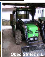
Obec Střítež n. L.