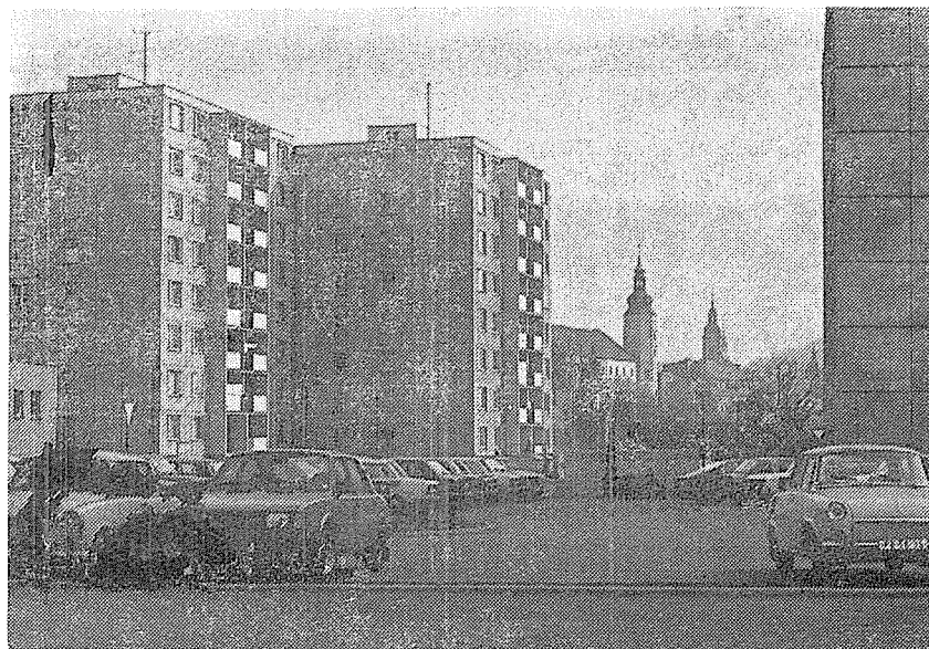
Fotografie Jiřího Andryška