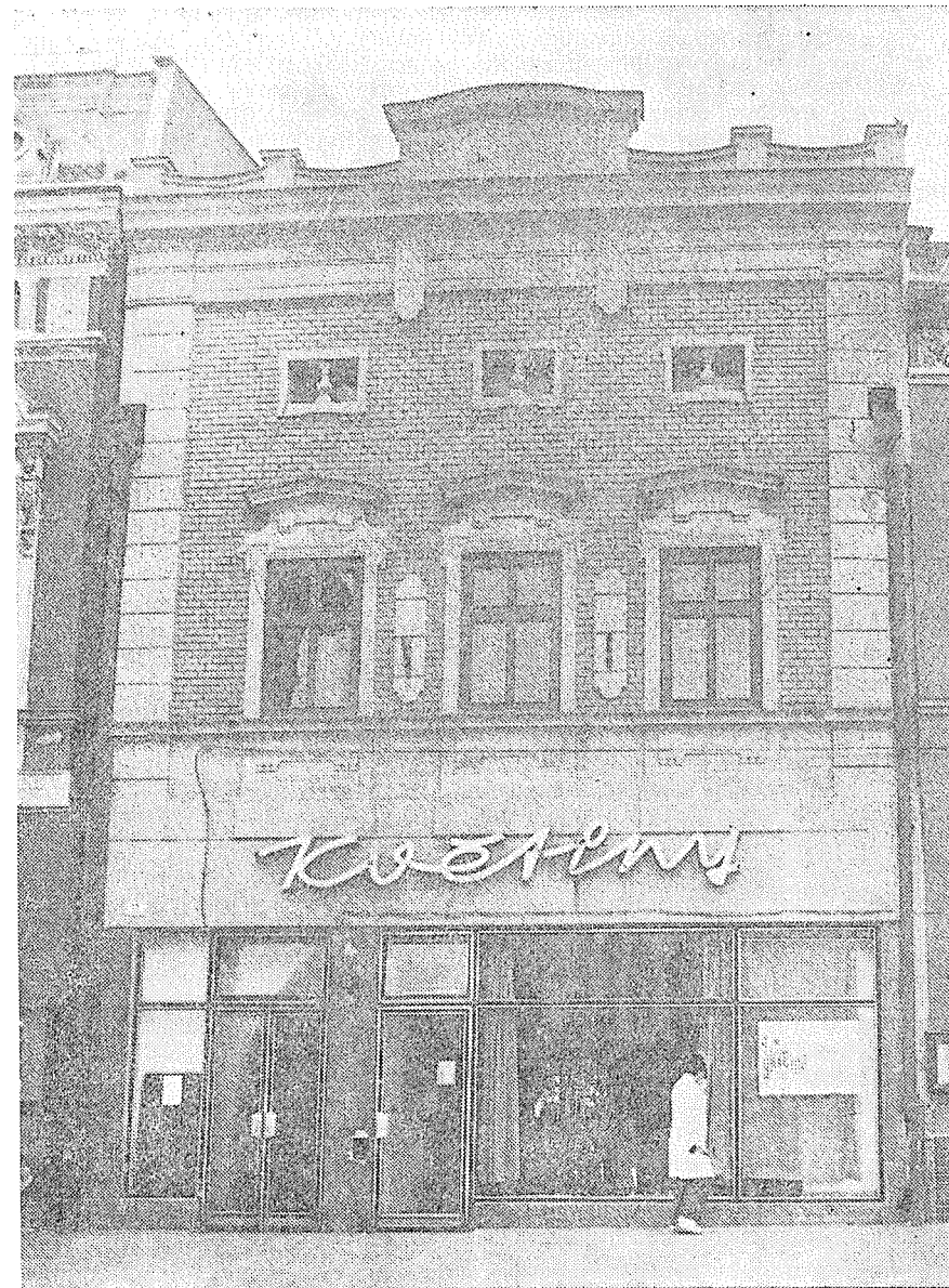
Dům čp. 11 na západní straně náměstí po renovaci