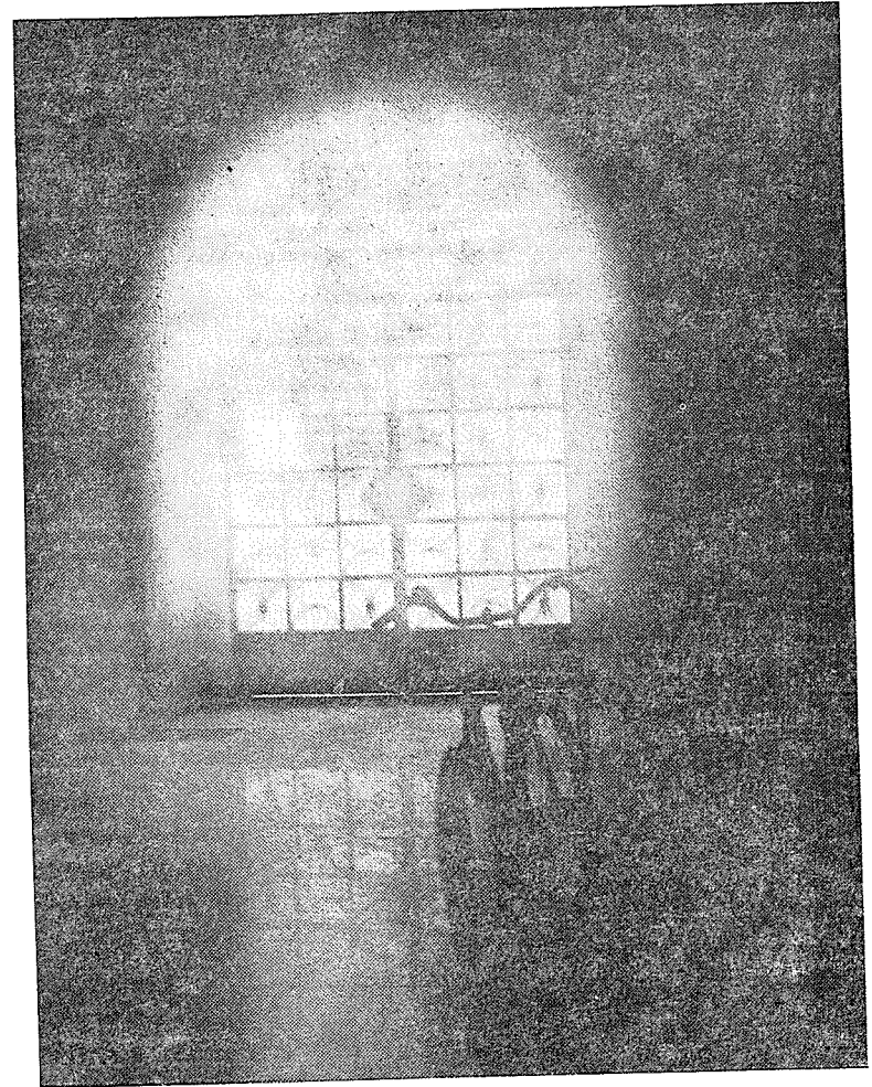
R. Kubíček: Radniční brána