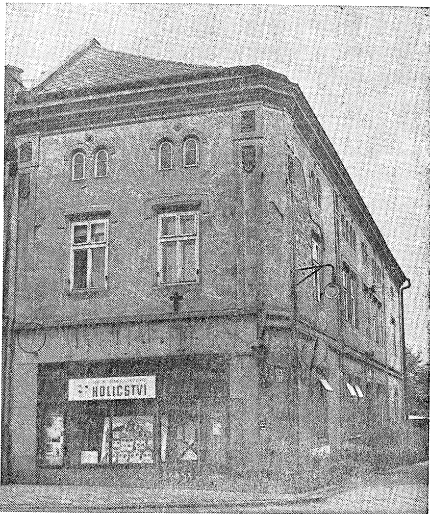
Dům Rillovský čp. 83 na rohu náměstí vedle Růžové uličky k městským hradbám.