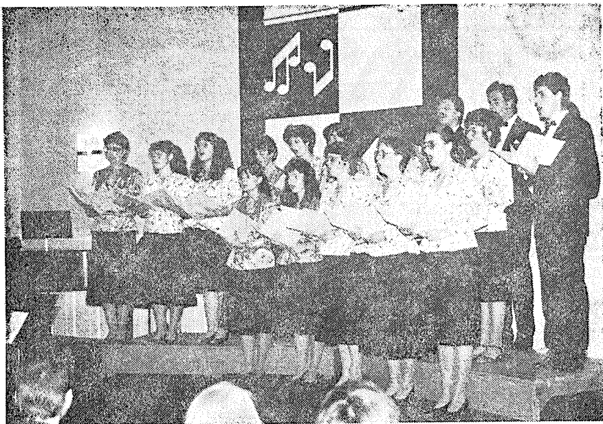
Pěvecký sbor „Harmonia“ zpíval 11. října t. r. v sále Lidové školy umění.