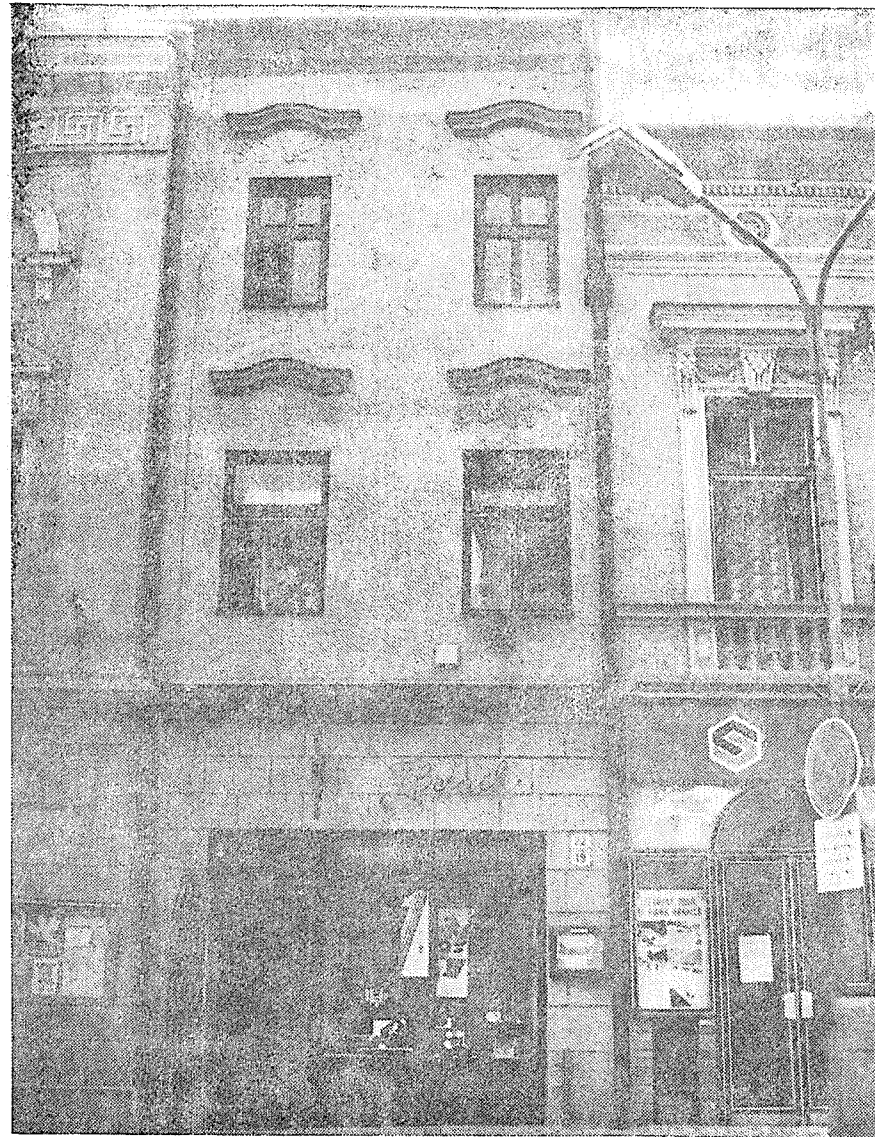
Dům čp. 19 před Dolním podloubím po renovaci. Fotografie M. Hlubinková 1988.

zaplatil. Jeho vdova Maruše Štemberská , zvaná pro rozlišení též Maruše Pavlíčka (ve městě bylo usedlých 6 rodin Štemberských), prodala r. 1587 stavebně vylepšený dům za 400 zl. měšťanu Lukáši Měchovskému . Ten jí složil hned závdavek 40 zl. a ročně měl dům splácet 10 zlatými dědicům Pavla Štemberského.