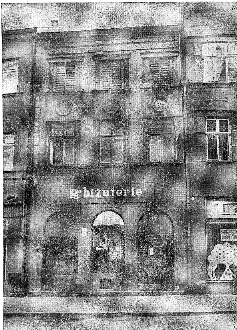
Dům č. 75 na náměstí vedle restaurace „Kufr“.