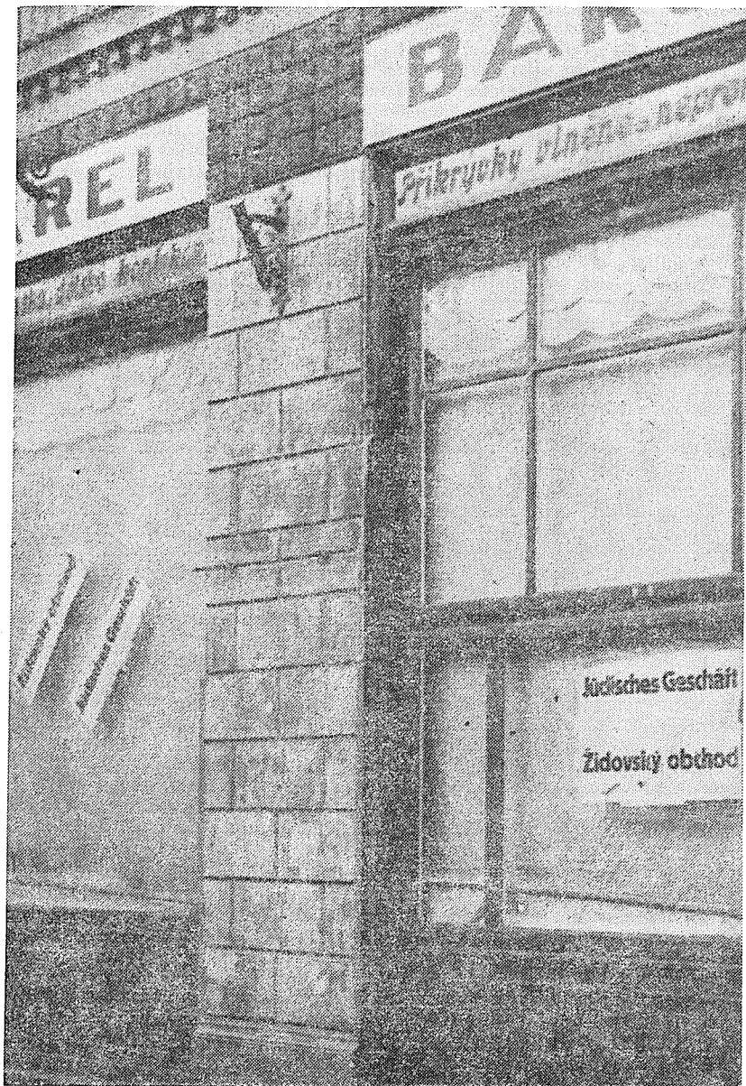
Část výloh nacisty uzavřeného Baronova obchodního domu v Janáčkově ulici s vylepenými plakáty „Jüdisches Geschäft“.