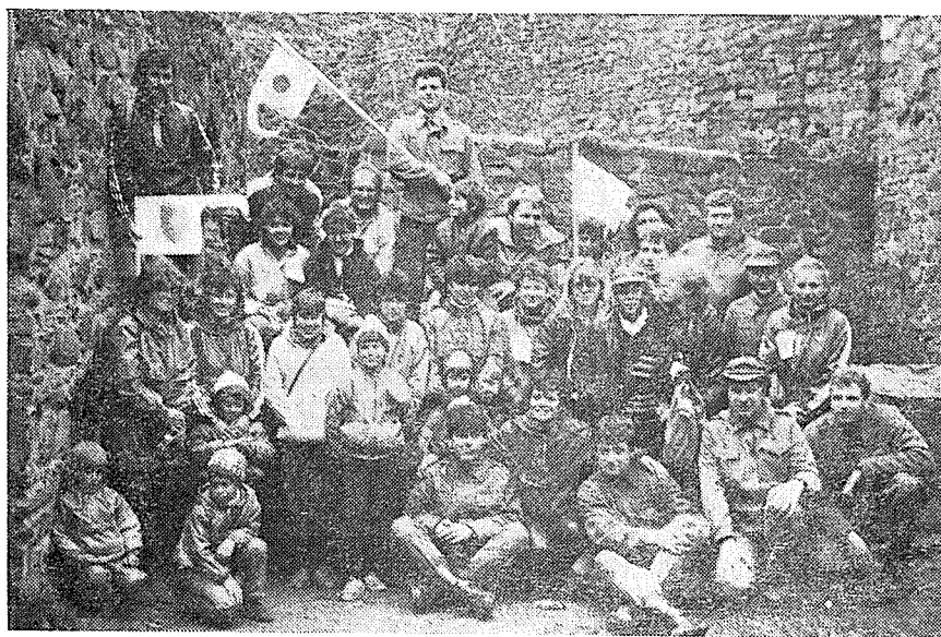
Účastníci „pochodu na Helfštýn“ na hradě.