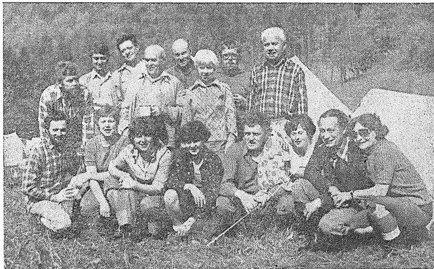
Hraničtí turisté na Krajském srazu vysokohorských turistů na Malém Rabštejně v r. 1978.