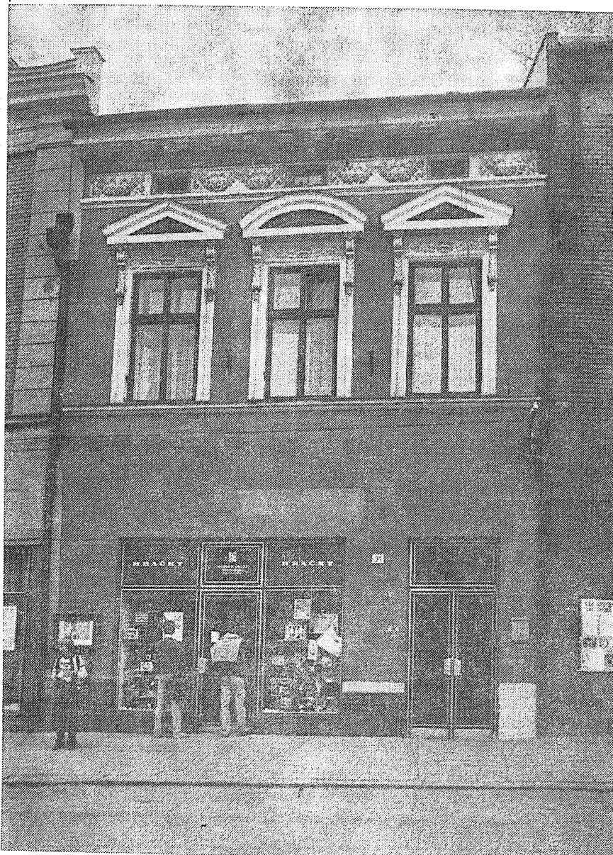
Dům čp. 10 na západní straně náměstí po renovaci. Foto M. Hlubinková 1988

ing. Vojtěch Richtár, CSc. jménem kolektivu spolupracovníků střední lesnické školy