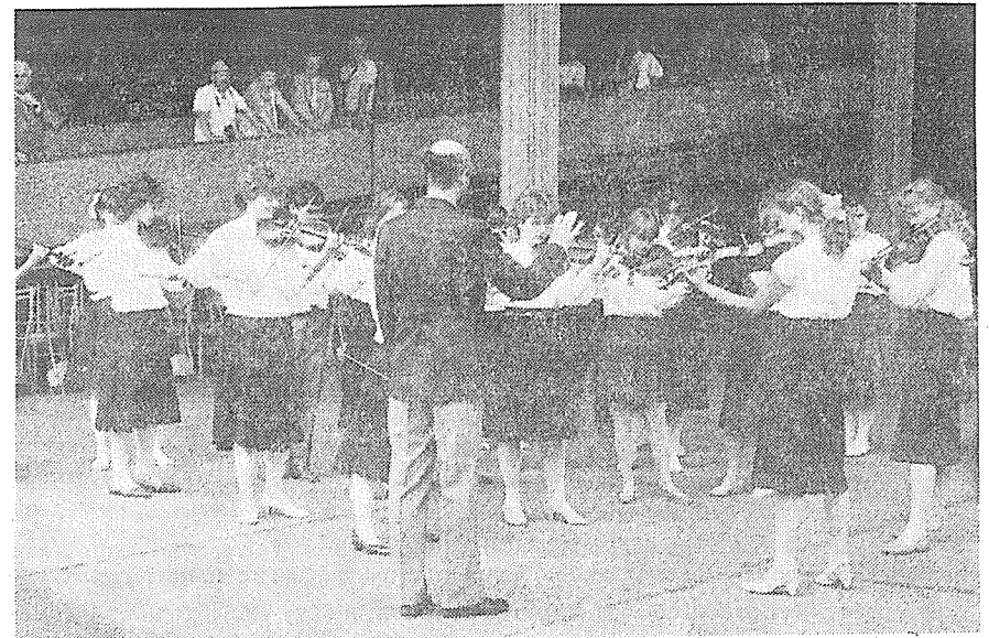
Žákovský orchestr LŠU Hranice před hotelem Termál v Karlových Varech.

Věříme, že tento úspěch bude podnětem pro další práci tohoto orchestru.