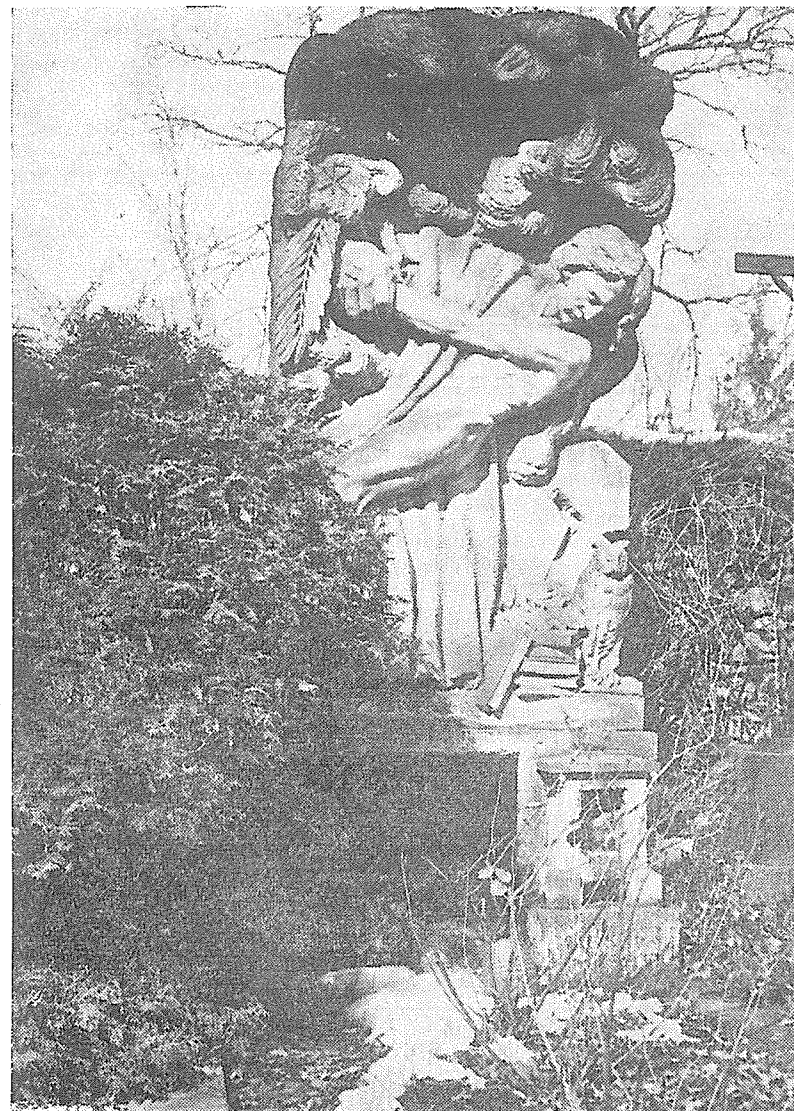
Náhrobek Josefa Janišky na hranickém hřbitově.