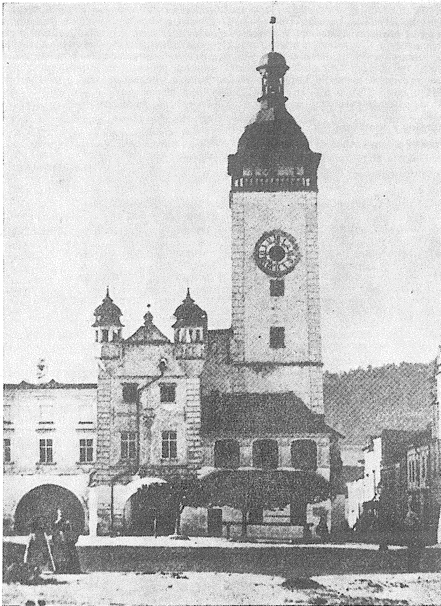
Fotografie hranické radnice z r. 1868 před její přestavbou v r. 1869. Reprofoto.

Součástí estetické výchovy na LŠU je vedle hudebního oboru také obor výtvarný. Má již dlouholetou tradici a v současné době v něm pracuje 115 žáků v 8 odděleních pod vedením s. učitelky Renáty Ambrůzové.