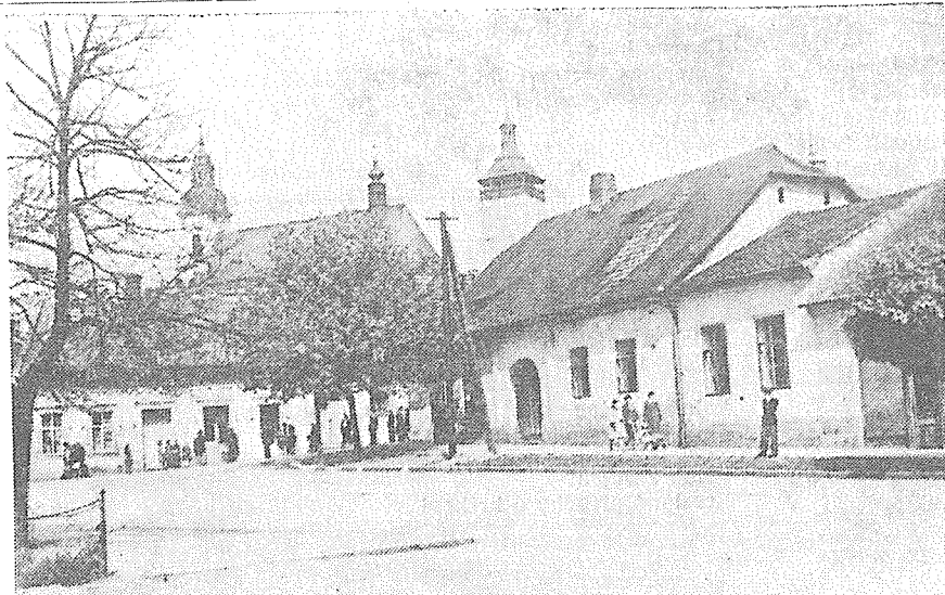
Křižovatka na Motošíně asi v r. 1943. Reprofoto.