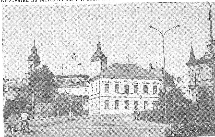
Křižovatka na Motošíně po výstavbě.