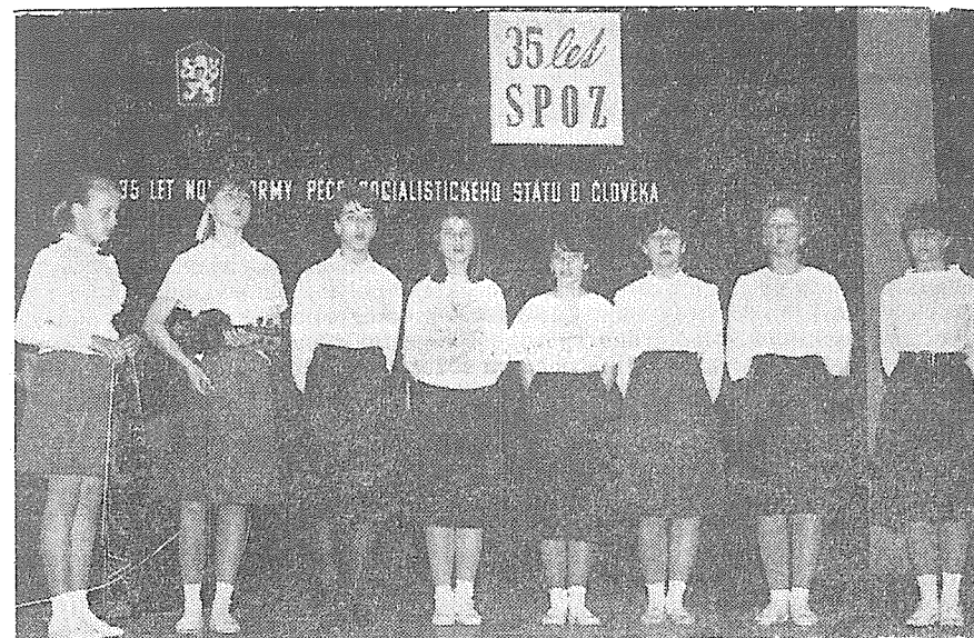
Soubor ZUČ při ZŠ Struhlovsko při vystoupení.