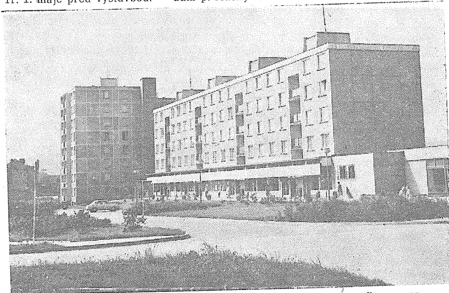
Tř. 1. máje po výstavbě