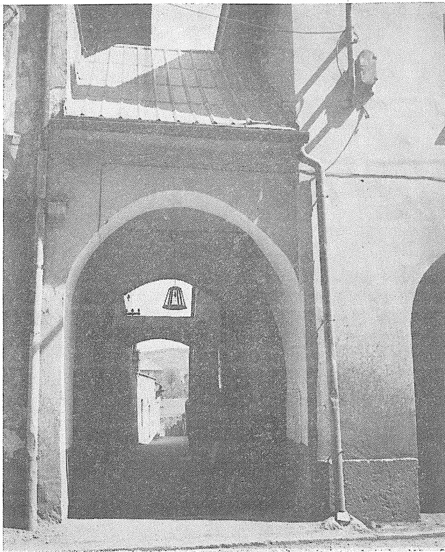
Ulička Pivovarské schody mezi domy čp. 103 a 104 na Horním podloubí. Foto K. Fon 1983