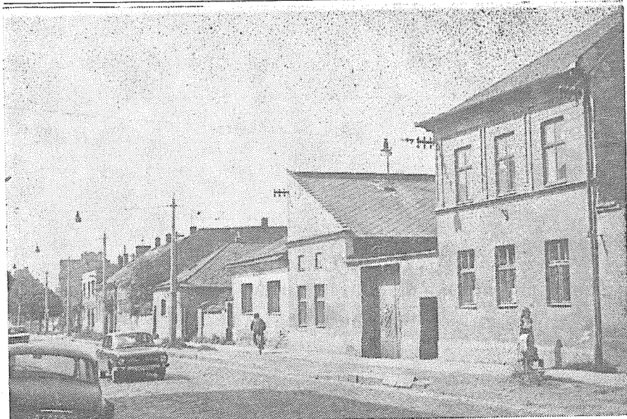
Tř. 1. máje před výstavbou. — dům p. Machyla.