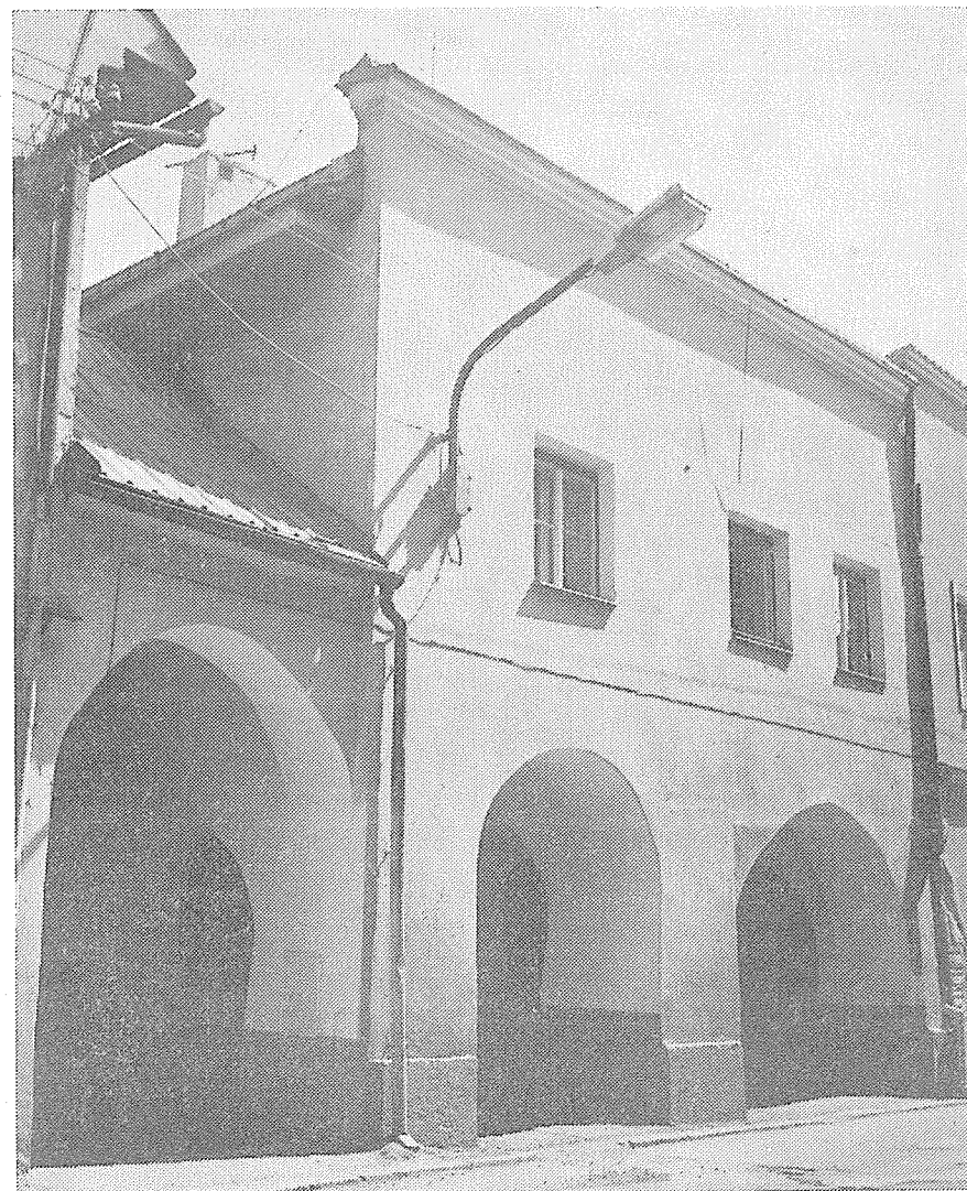
Dům Lidové školy umění čp. 103 na Horním podloubí. Foto K. Fon 1983.

B. Indra: K renesančnímu stavitelství na severovýchodní Moravě a ve Slezsku, Časopis Slezského muzea (Opava) 1966, s. 128–148.