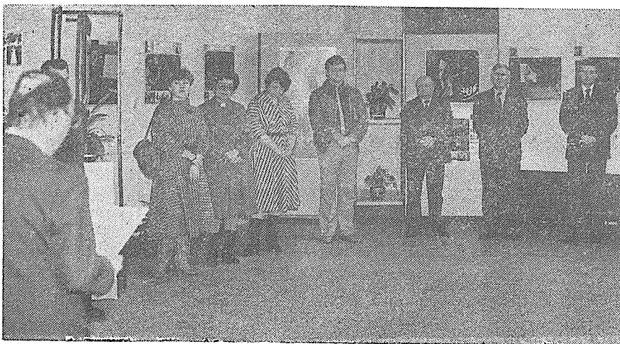
Snímek z vernisáže výstavy „Život a dílo K. Szymanovského“ dne 13. 1. 1988 ve výstavní síni SK ROH.