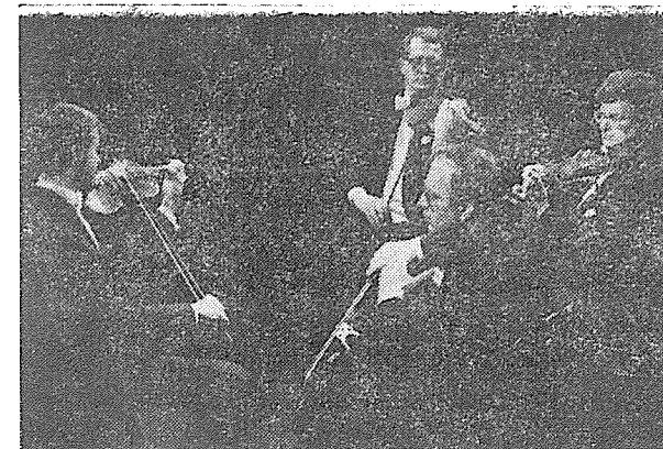
Kvarteto města Brna v novém obsazení.