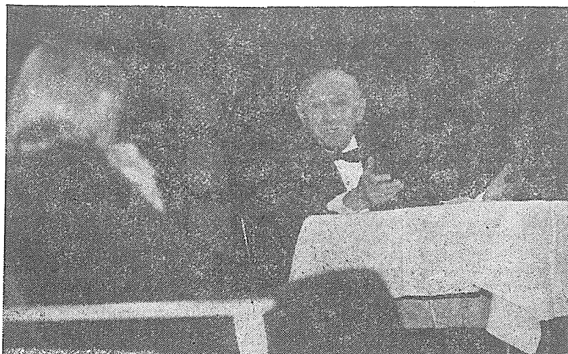
Zasloužilý umělec František Filipovský v programu „Pohledy z jeviště“ dne 23. 1. 1988 v sále SK ROH.