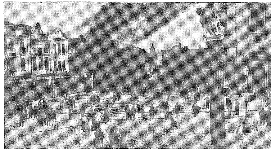
Požár domu čp. 89 a okolních domů na náměstí v r. 1921.