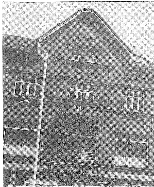
Dům čp. 89 na náměstí po renovaci.