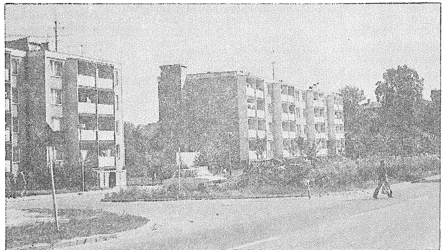
tř. 1. máje po výstavbě.