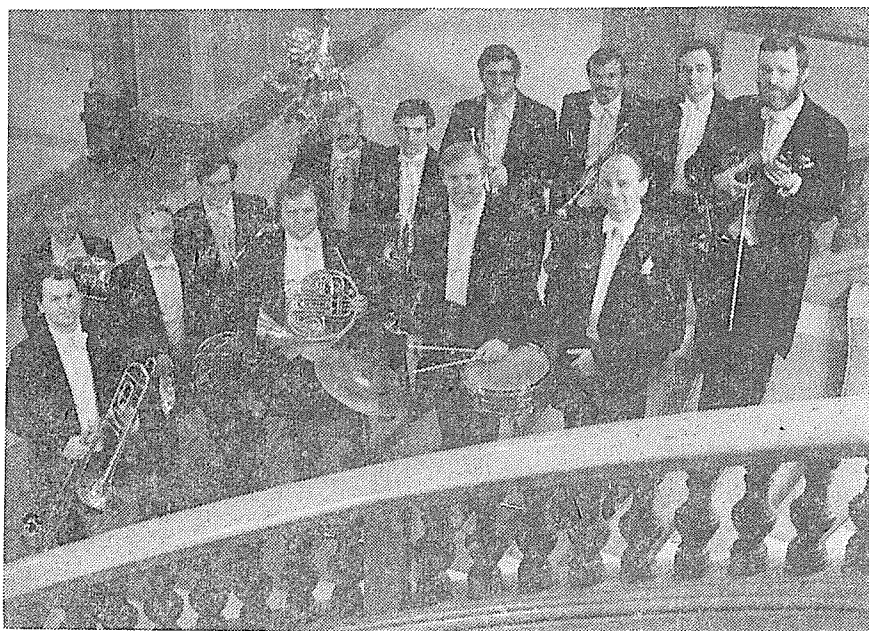
Soubor BRASS BAND BRNO