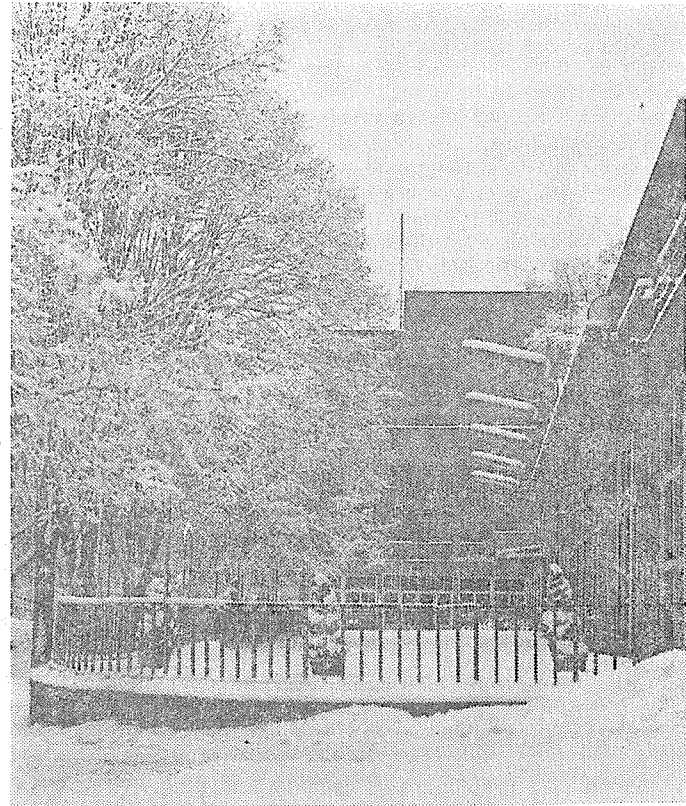
Teplice v zimě.