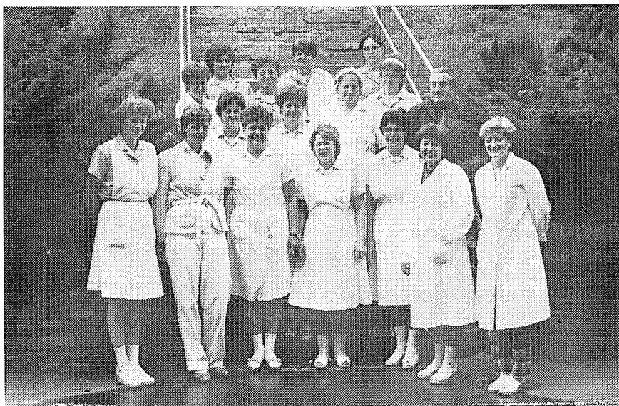
Kolektiv BSP dětské léčebny Radost.

Struktura našich pacientů se změnila s rozvojem kardiochirurgie. Přibývá dětí předškolního věku a počet dětí po operaci srdce tvoří až 50 % z celkově přijatých pacientů. Naším cílem je stále zkvalitňovat nejen léčebnou, ale i výchovnou péči.