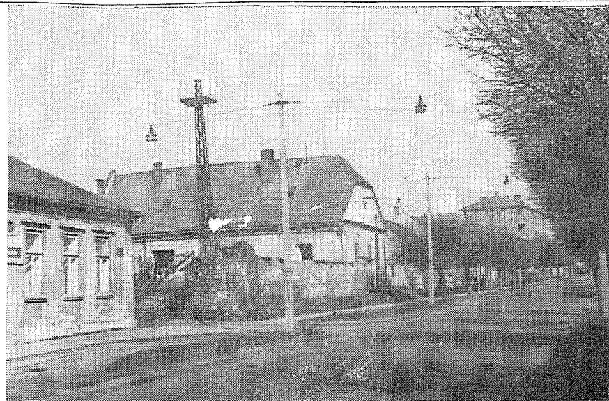
tř. 1. máje před výstavbou — obecní dvůr a restaurace Slimáček