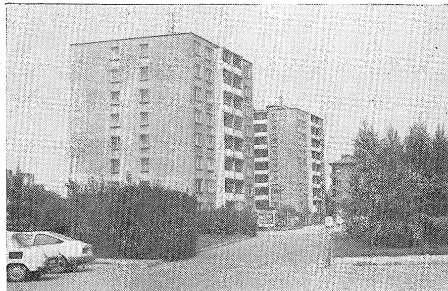
tř. 1. máje po výstavbě