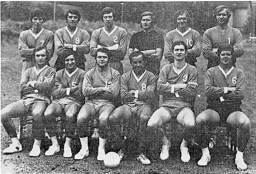
Prvoligové družstvo mužů v r. 1974.