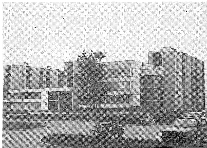
Třída 1. máje po výstavbě, zubní oddělení OÚNZ