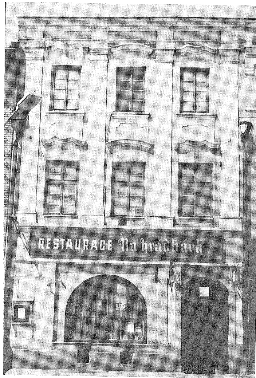
Dům restaurace „Na hradbách“, čp. 7 na náměstí