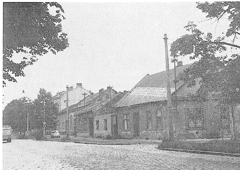
Třída 1. máje před výstavbou, restaurace u Halenčáků