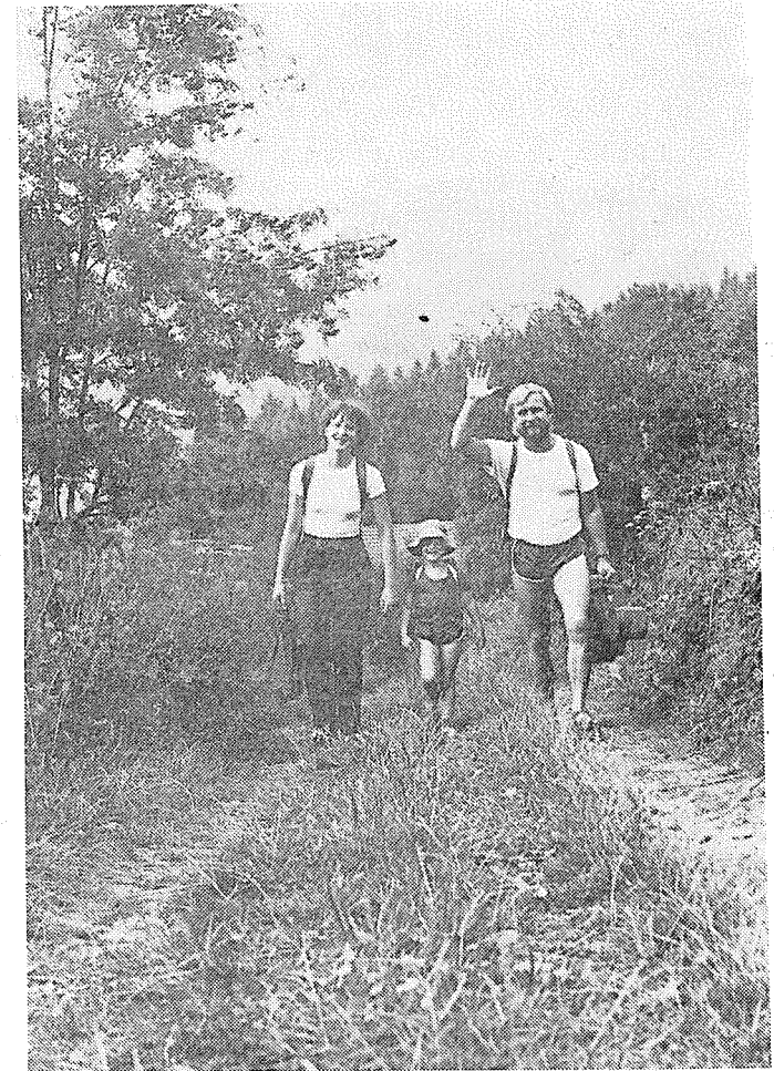
Zdeněk Palacký: Ahoj, léto!