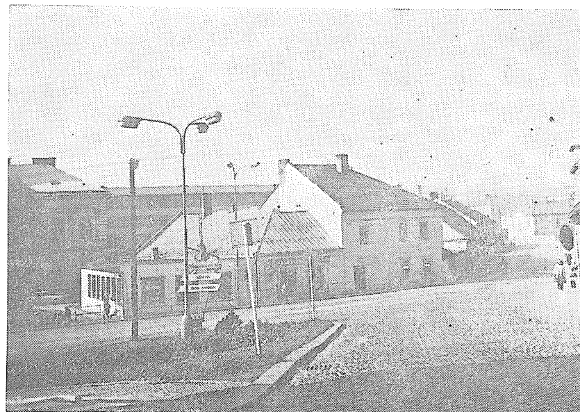
Ulice Čr. armády (Motošín) před rekonstrukcí silnice.