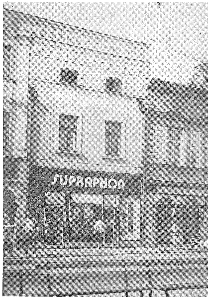
Dům čp. 6 na náměstí vedle lékárny.