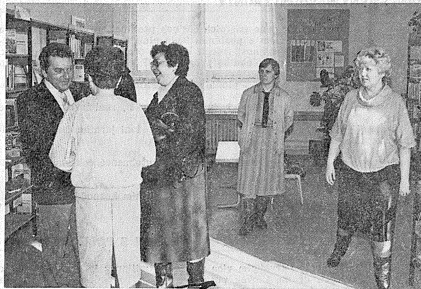
Součástí nového kulturně výchovného zařízení je i pobočka Městské knihovny.