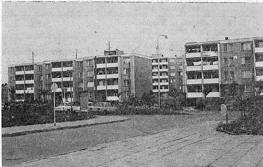
Třída 1. máje po výstavbě.