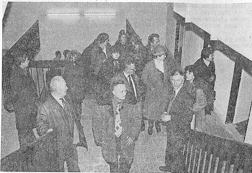
Dne 24. 2. 1987 si u příležitosti oslav 39. výročí Vítězného února přišli představitelé městských i okresních orgánů a organizací prohlédnout nové kulturně výchovné zařízení na třídě 1. máje.