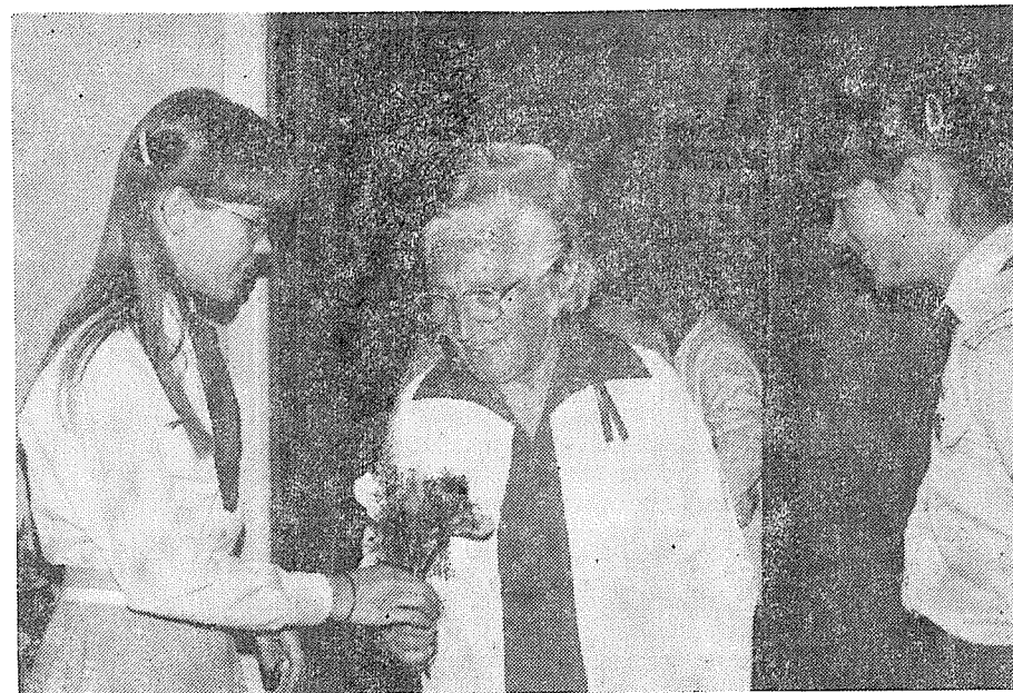
Uvítání jubilantů při vstupu do sálu.