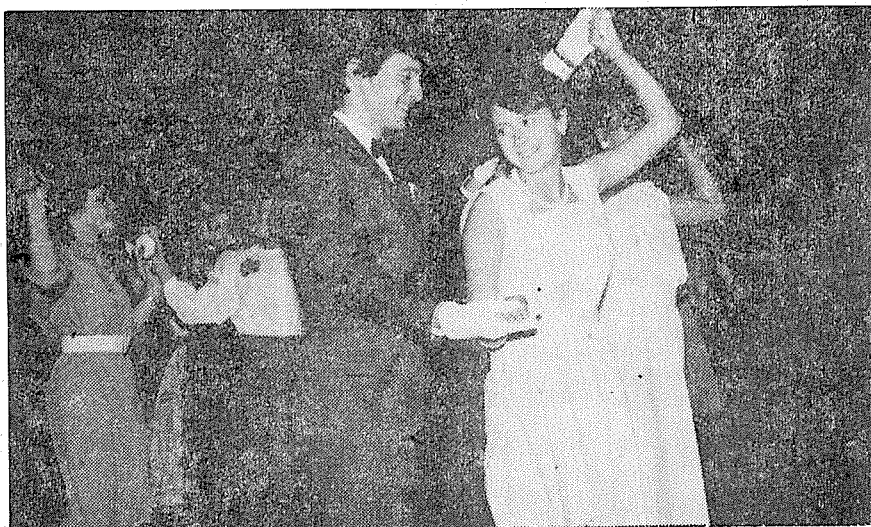
Záběr z prodloužené dne 31. 10. 1986