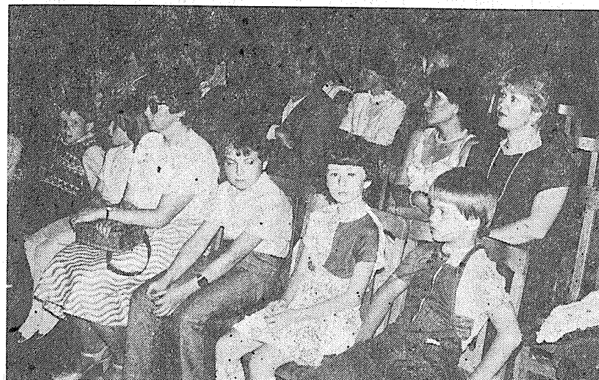
Pohled do publika slavnostního koncertu 25. 5. t. r.