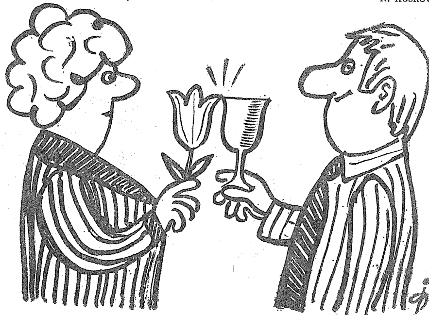
Kresba Jaroslava Popa