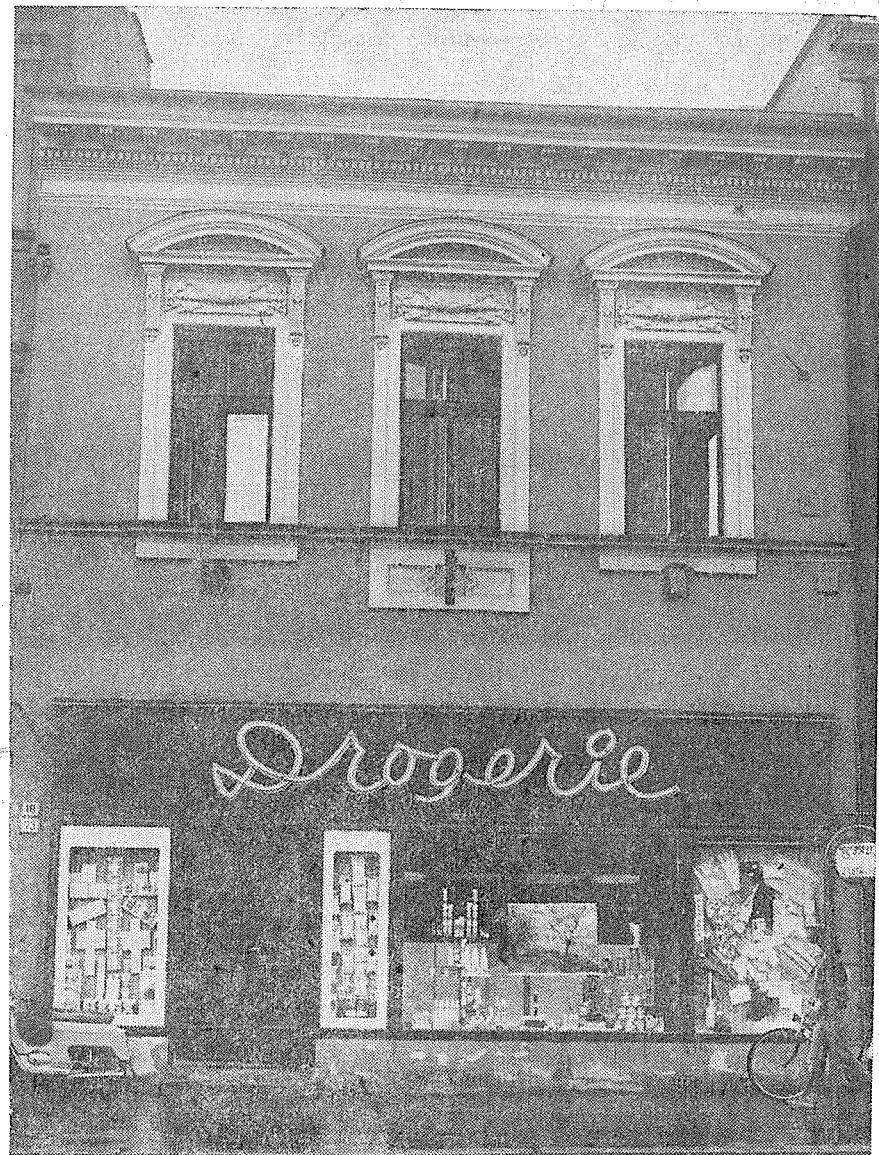
Dům čp. 73 na náměstí u radnice po renovaci.