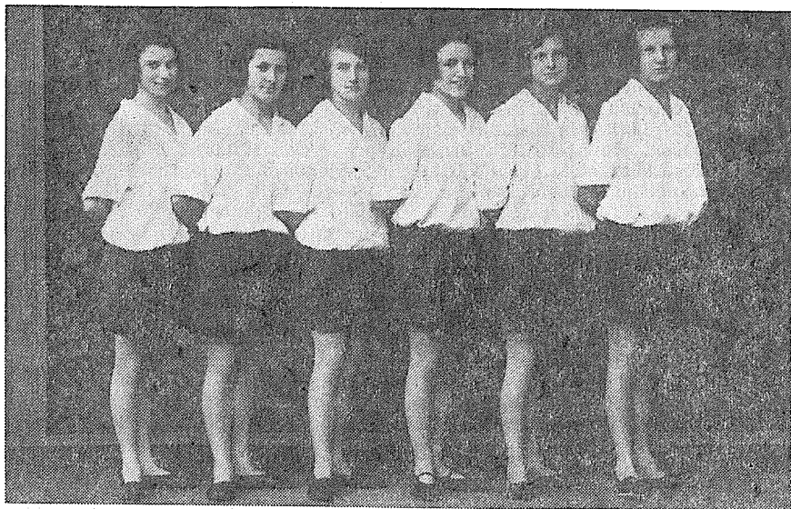
Hranické dorostenky ze závodů v Přerově z r. 1926