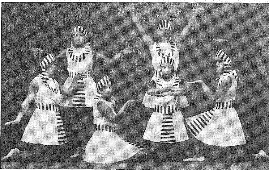
Ženy v pódiové skladbě H. Vácové „Egyptské kresby“ na všesokolském sletu v Praze v roce 1932.

období celého díla. Na veřejné cvičení se přišlo podívat přes 5.000 lidí z města i okolí.