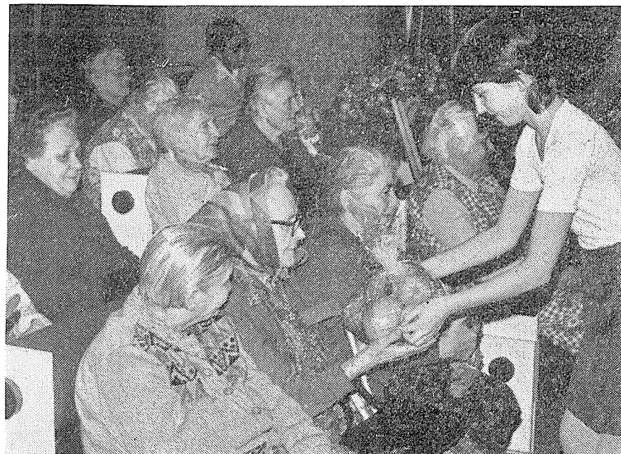
Na snímcích Čestmíra Novotného záběry z předvánoční besídky v Domově Důchodců.