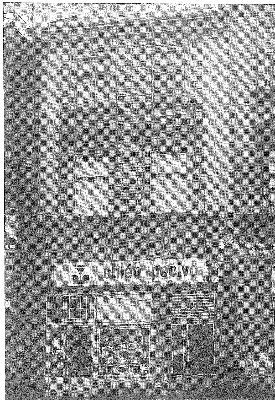
Dům čp. 95 na náměstí před renovací.

Z přízemí chodby vedly kamenné schody do prvního poschodí domu, kde byla vřadu jedna velká světnice s dvěma okny do dvora, dlouhá 4 sáhly 2 stře-