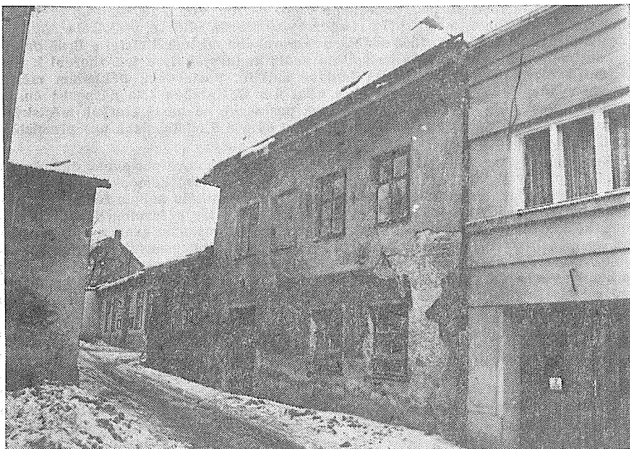
Zadní část ulice Na náspech

Furkrechtní knihy města Hranic, archiv velkostatku Hranice—Lipník, Státní archiv Opava, pracoviště Janovice u Rýmařova