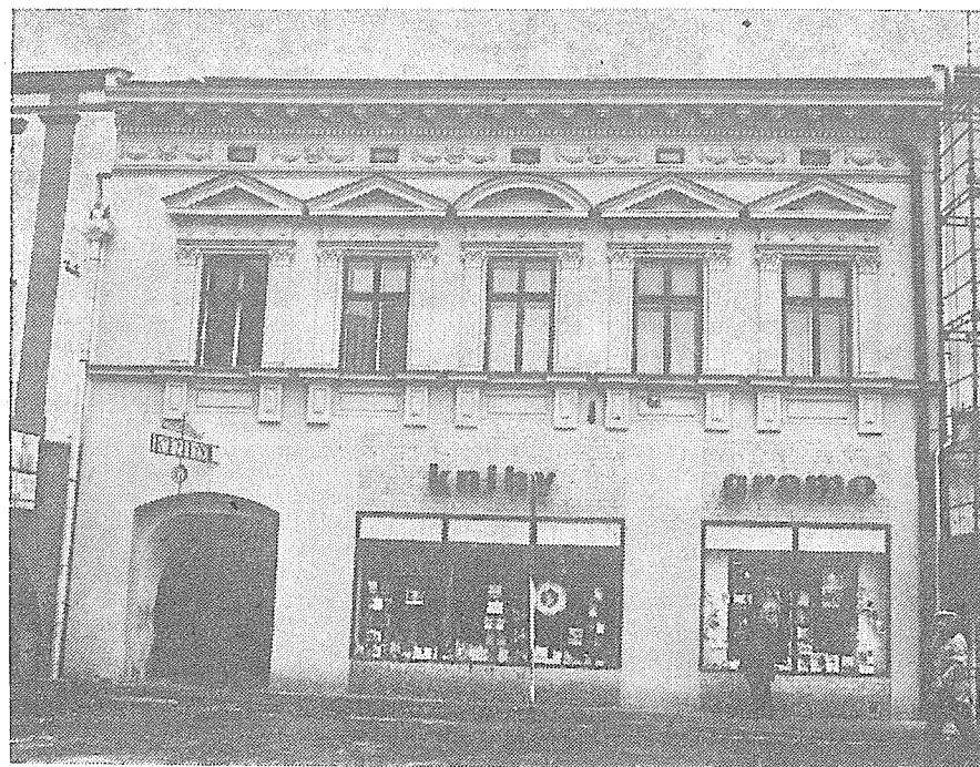
Dům č. p. 96 na náměstí po renovaci.

Řadový městský dům čp. 96 na rohu Gottwaldova náměstí a ulice Zápotockého, stavebně renovovaný v letech 1983—1984, v jehož přízemních moderně adaptovaných prostorách klenutého hýv. domovního loubí je dnes umístěno knihkupectví, patřil po staletí k největším právovarečným měšťanským domům ve městě. V jeho držbě se vystřídala řada rodin, z nichž některé hrály v osudech města i kraje vyznačnou roli.