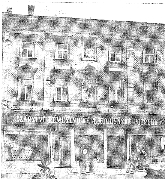
Dům čp. 92 na náměstí před otevřením zazděného domovního podloubí.