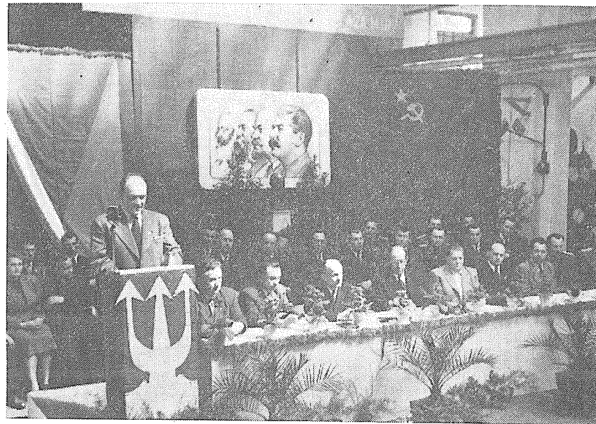
Na fotografii si přibližujeme slavnostní okamžiky z návštěvy prezidenta s. Zápotockého v hranické Sigmě v roce 1955.