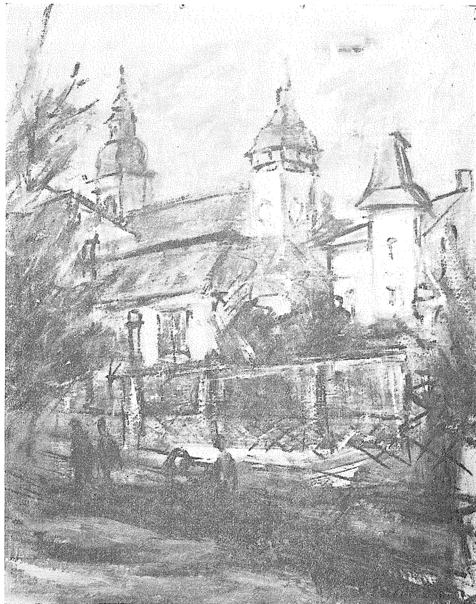
Jaroslav Štěpán: Hranické věže.

Jenže — na štěstí — u kumštýřů, ať už patří ke kterémukoli odvětví, se věci mají jinak. V tomto věku stojí téměř na vrcholu své umělecké potence a zda-