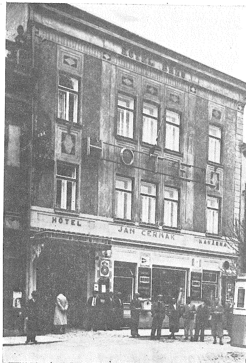
Dům hotelu Brno kol. r. 1930