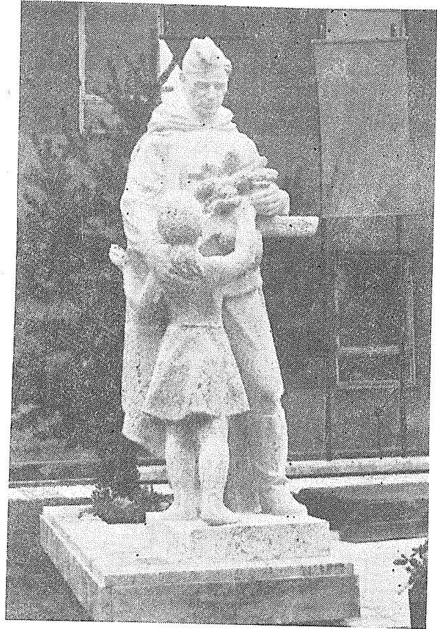
Sousoší „Vítání Rudé armády“ zasl. umělce ak. sochaře R. Doležala na Školním náměstí v Hranicích.