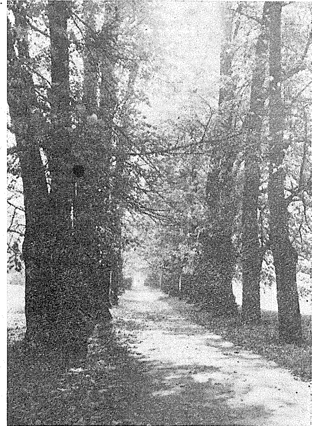
Slunný den koncem října