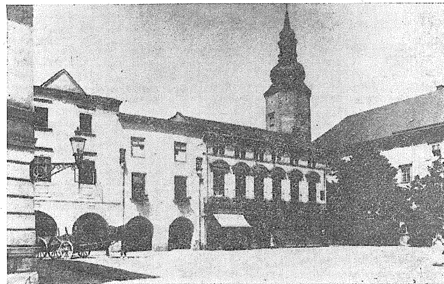
Domy čp. 3, 2 a 737 na náměstí u zámku poč. 20. století Foto Ferd. Helsenr, Hranice, 1905