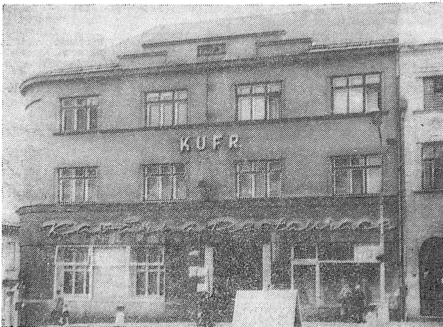
Dům kavárny a restaurace „KUFŘ“ na náměstí