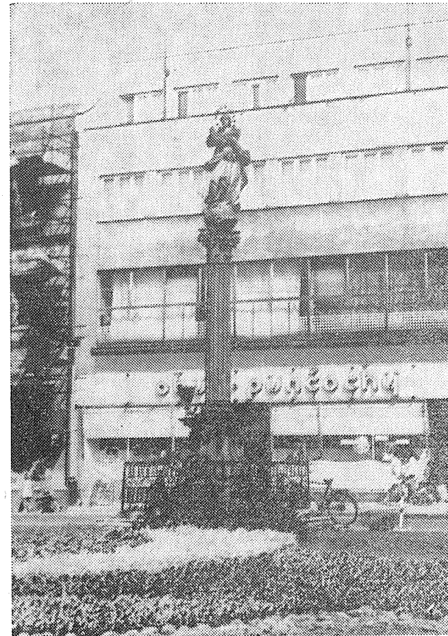
Dům JKP č. p. 121 na náměstí s mariánskou sochou z r. 1729 (foto 1976).

Starý zbořený dům byl vystaven jako zděný od základů v první třetině 16. století na místě dřívějšího převážně dřevěného domu při plánovité výstavbě domů na