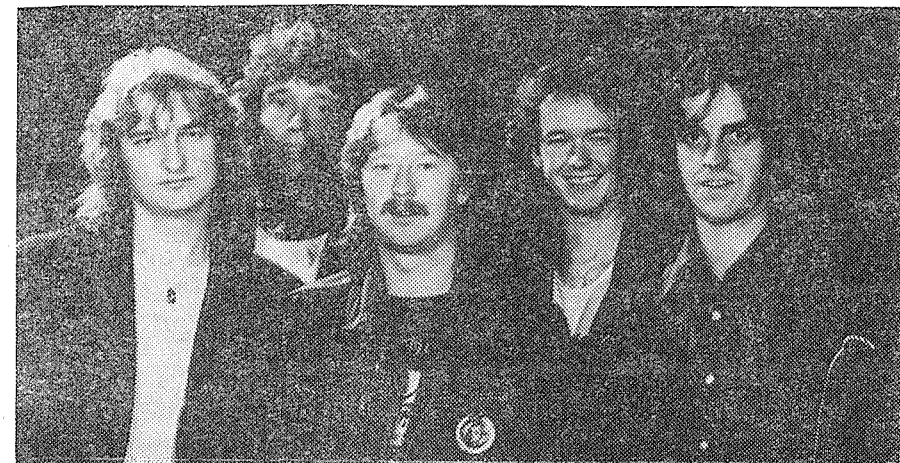
Na snímku rocková skupina Citron v současném obsazení

Koncert skupiny CITRON se uskuteční v Hranicích dne 22. února 1984 v sále JKP v 19.00 hod.