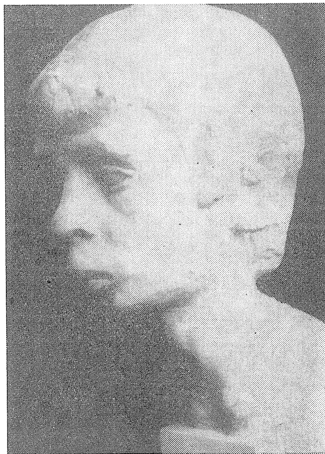
Marek Ludmila: Chlapec (plastika)