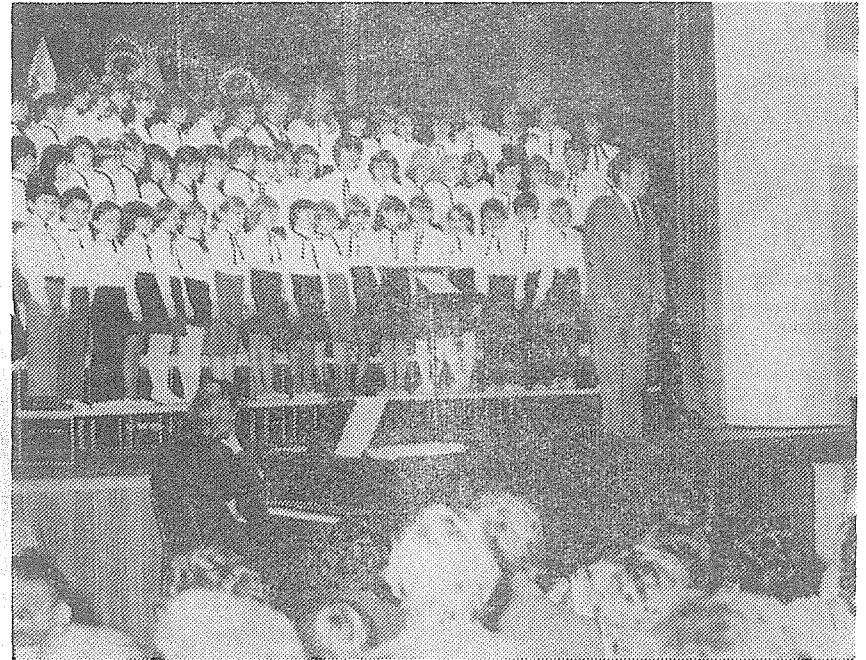
Hranický dětský pěvecký sbor