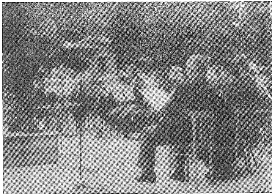
Záběr z vystoupení našeho dech. orchestru ve Štětí