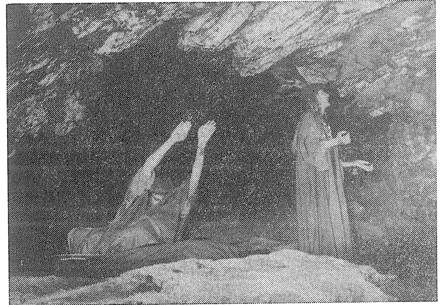
k článku Divadlo v jeskyních