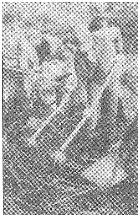
„Brontosaurus v Hranicích“

různým haraburdím, lahvemi starými několik desítek let ale i konzervami ve kterých byly ještě zbytky nedávno spotřebovaného obsahu. Obnovilo se i značení rezervace.