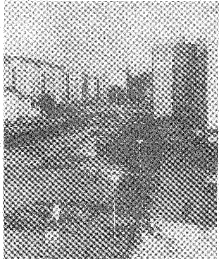
Třída 1. máje na fotografii ing. Vladimíra Foltánka.