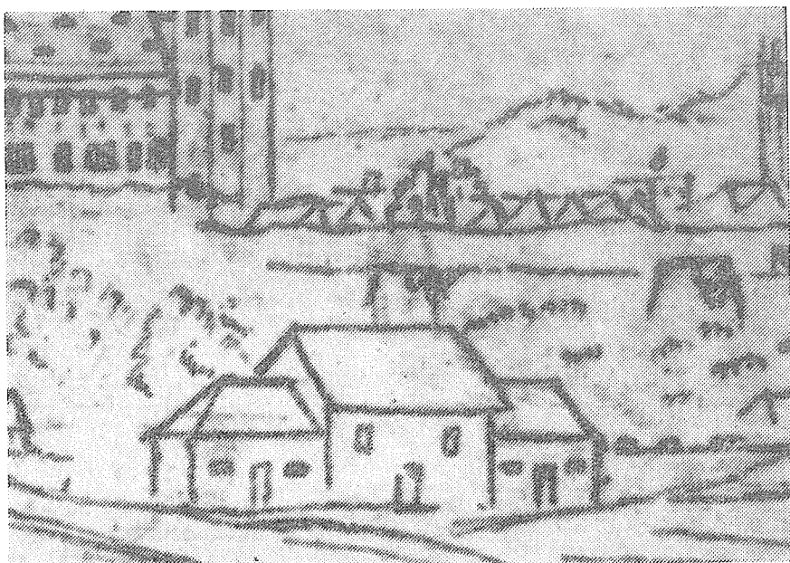
Solnice s přistavěnými domky r. 1811.

Stát měl v té době monopol dovozu a prodeje soli , dovážené z Wieličky v Haliči, dovoz a prodej byl přísně kontrolován. Při úpravě kostelíka pro účely transportního skladu soli pro c. k. bankální úřad bylo r. 1787 zbořeno presbyterium, celá stěna zazděna až na malé spojovací dveře, zazděna půlkruhová okna lodí i páté okno nad bývalým vchodem do kostelíka, a po obou stranách kostelíka přistavěny malé domky. Na obou stranách kostelní lodí byly prolomeny dveře pro dovoz a odvoz soli a zřízena menší tři okna. Sálková místnost kostelíka byla přepažena a upravena na uložení 6000 centnýřů soli . Stavební plány kostelíka před přestavbou a jeho přestavby, zhotovené tesařským mistrem Josefem Románkem r. 1787 jsou dochovány. Správu solnice vedl c. k. solní s písařem, drábem a pomocným personálem. Sůl byla dovážena z Haliče formanskými povozy po císařské silnici. Odtud byla pak sůl vydávána na všechna okolní panství ustanoveným c. k. prodavačům soli, od nichž ji kupovali obce a spotřebitelé.