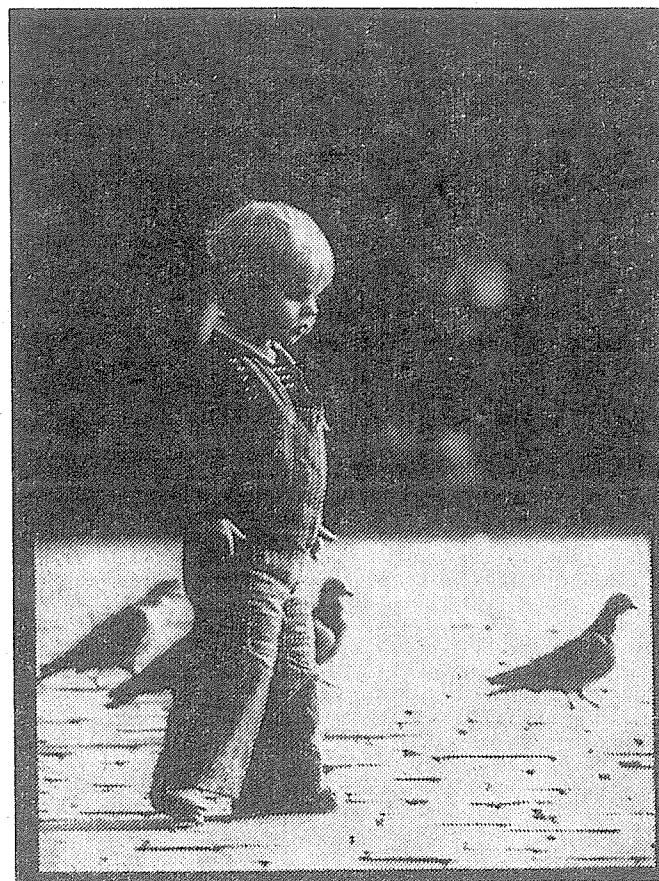
Fotografie Milana Mráze