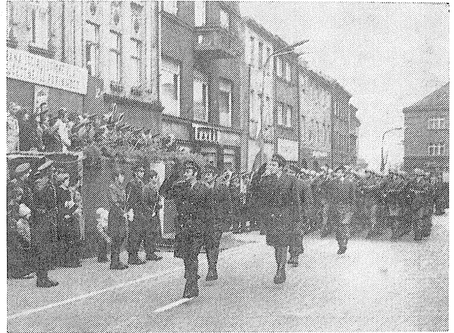
Z oslav Dne Československé lidové armády v Hranicích