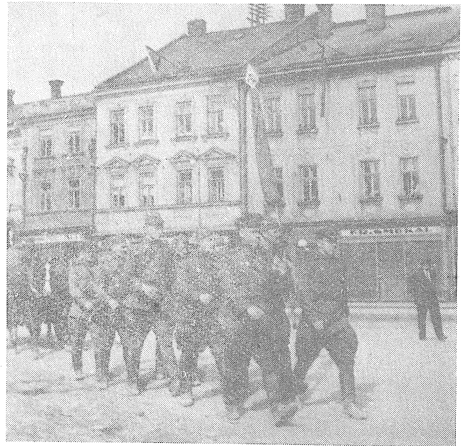
8. květen 1945 — osvobození Hranic Sovětskou armádou