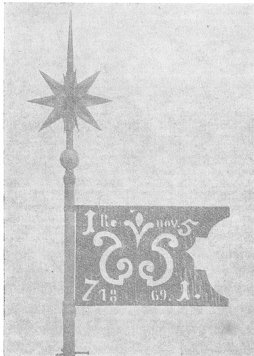
Kovová korouhvička na hrotu věže.

Oprava budovy radnice v Hranicích pokračuje dále a bude podle záměrů pracovníků OSP dokončena v květnu 1980.