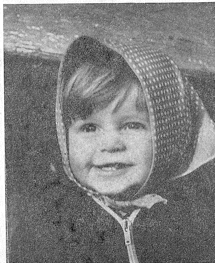
Fotografie Gustava Giebla