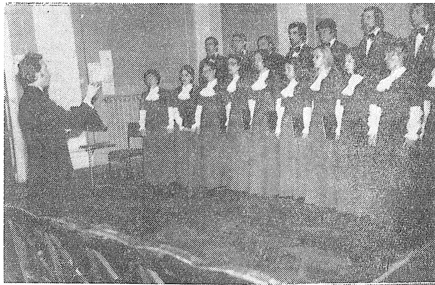
Vysokoškolský pěvecký sbor ORGANUM z Krakowa — PLR.