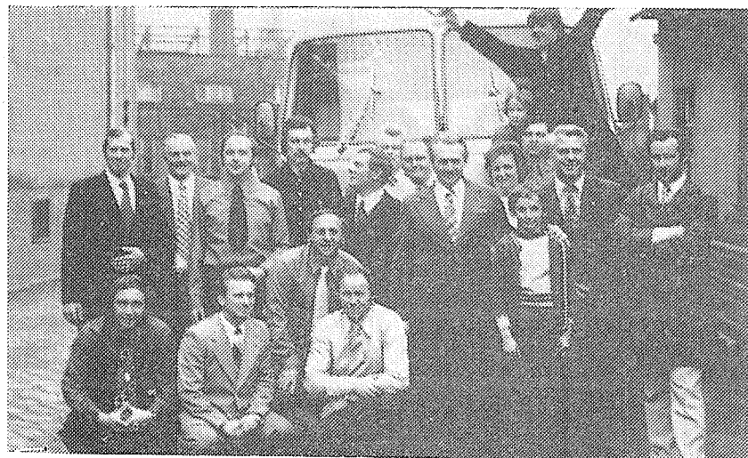
Snímek z návštěvy tanečního orchestru JKP v Salzwedelu v NDR. Na snímku členové souboru se svými německými hostiteli. Zpráva o návštěvě souboru v NDR byla uveřejněna v minulém čísle Zpravodaje.

Tichému, hodnému člověku mnoho zdraví a hodně dalších ušlých kilometrů přejí turisté TJ SIGMA HRANICE.