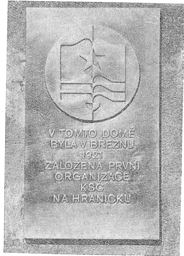
Pamětní deska k 55. výročí založení KSČ v Hranicích umístěná na budově zemědělského odborného učiliště.