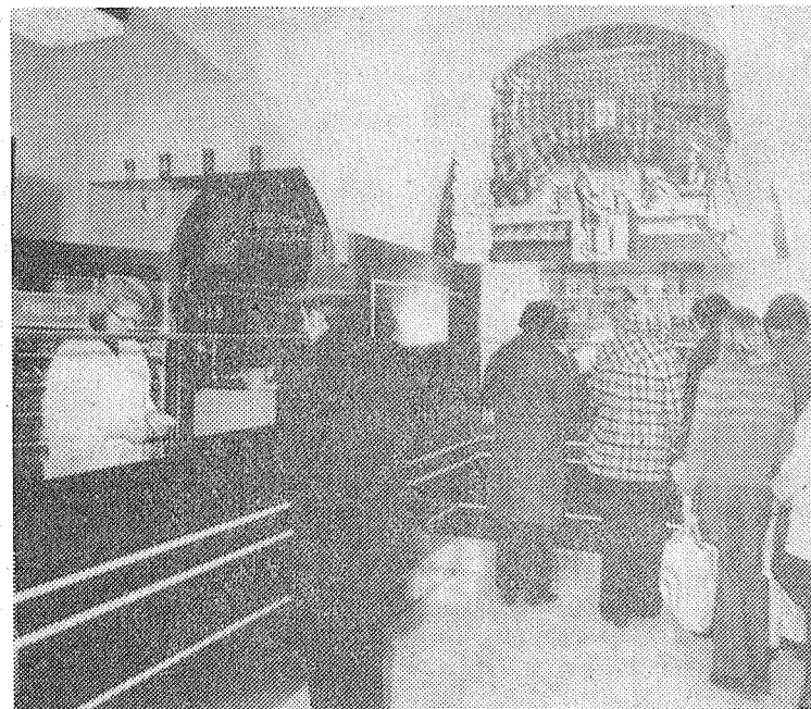
Interiér lékárny na Gottwaldově náměstí.

Podíl na provedení těchto náročných prací má Okresní průmyslový podnik Kovo-