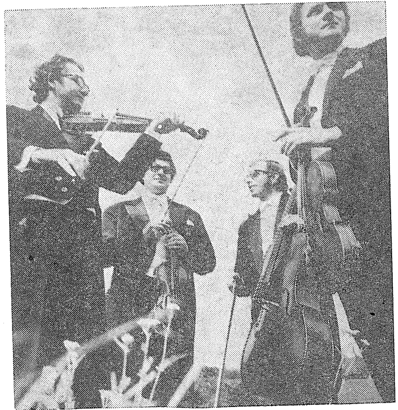
KVARTETO MĚSTA BRNA