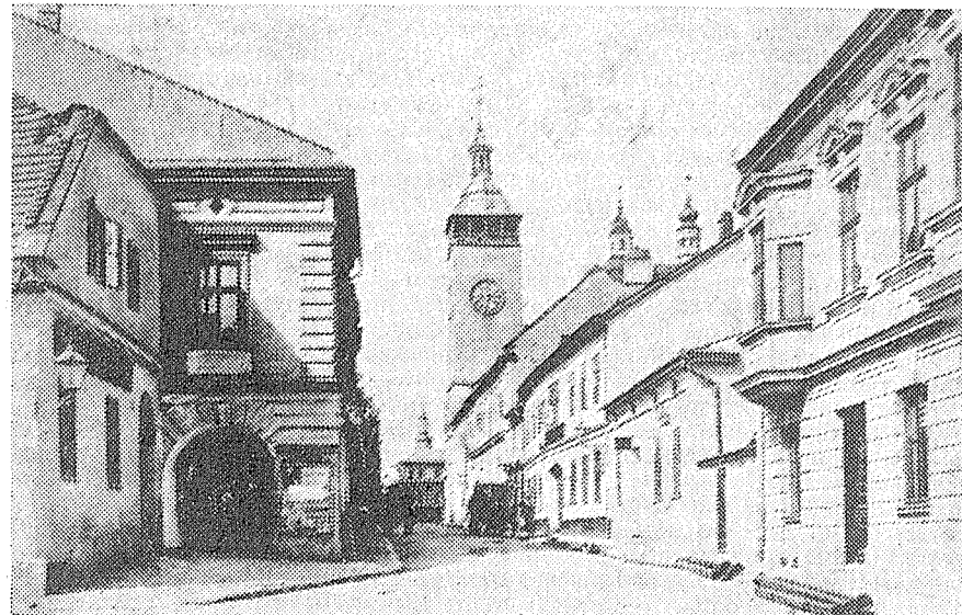
Bývalý hotel „Pošta“ (nyní restaurace Tunel v Leninově ulici) č. p. 168 a sousední č. p. 169, v nichž byla umístěna poštovní stanice a telegrafní úřad v II. polovině 19. století.