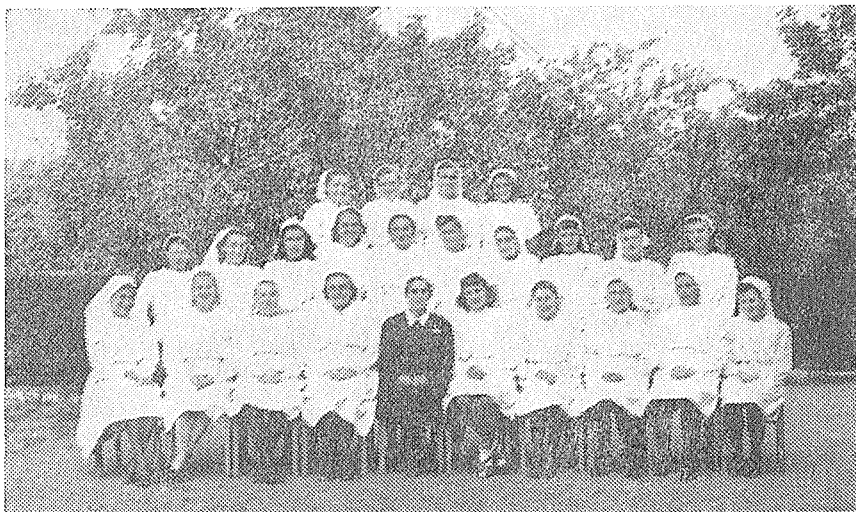
Absolventky I. kursu dobrovolných sester ČČK v Hranicích v roce 1946

Kromě uvedených nárazových akcí fungovaly odborné dobrovolných sester, samaritánů, dorostu ČK a záchranná stanice a probíhaly i různé jiné činnosti charitativního rázu. Tato činnost se během dalších let postupně omezovala s budováním státní zdravotní péče. V r. 1951 byl například zastaven provoz záchranné stanice a vozidla byla předána Okresnímu ústavu národního zdraví v Hranicích. (Pokračování v příštím čísle)