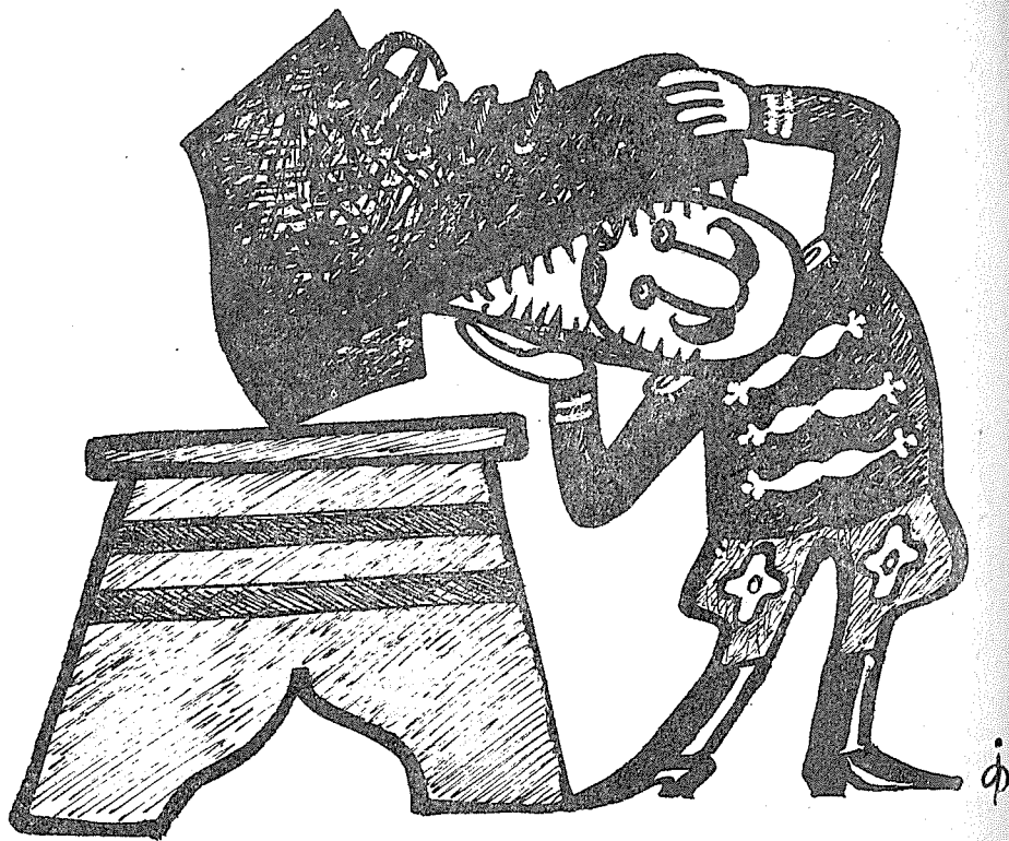
Kresba Jar. POPA.

časopisu Pardon, který byl kromě jiných šéfredaktorů humoristických a satirických časopisů přítomen. Kresba pak byla otištěna v Pardonu.“